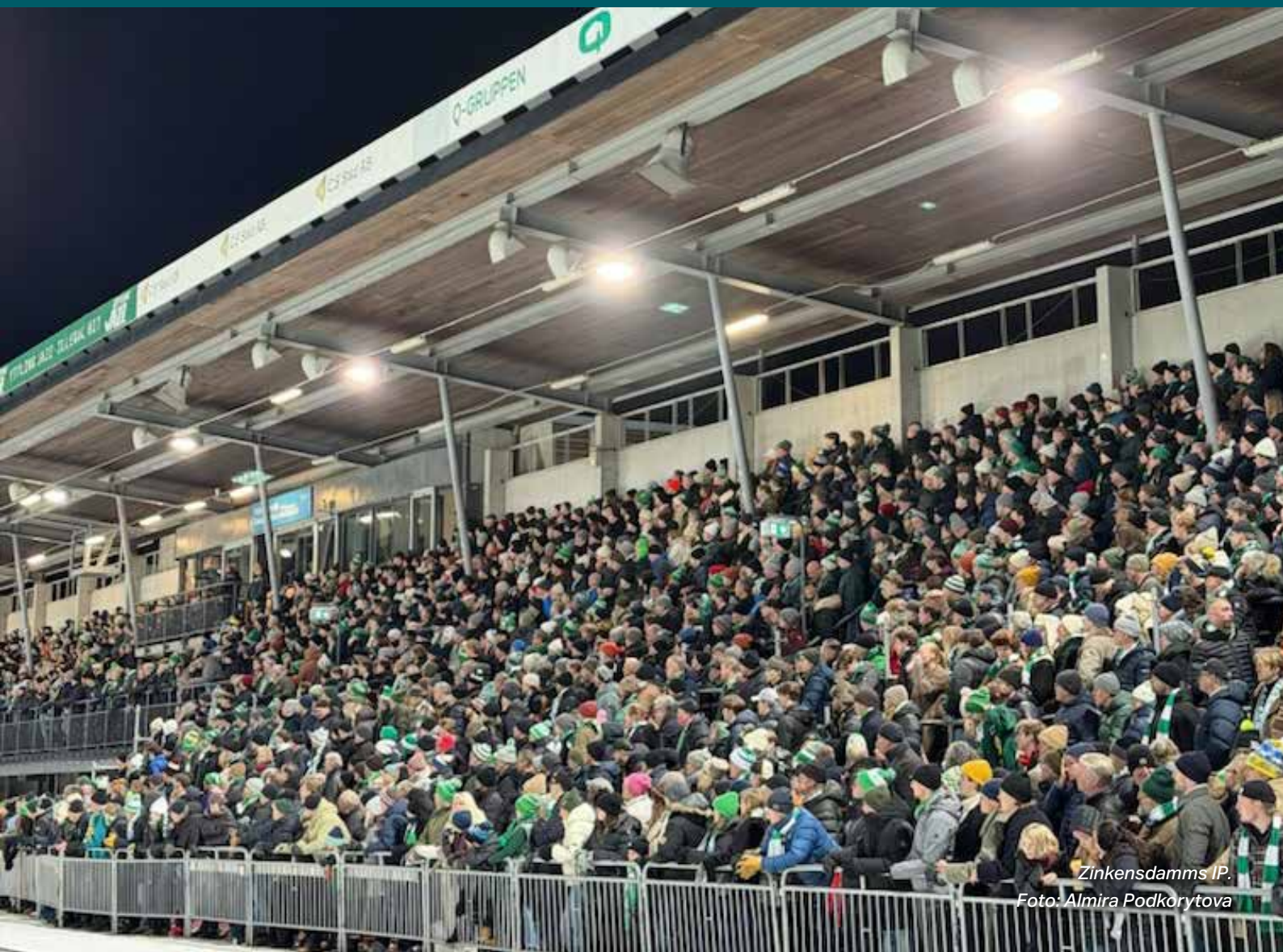
Zinkensdamms IP.